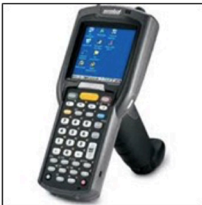
Figura 2: Coletor de códigos de barras.

A empresa em questão possui o sistema WMS ( Warehouse Management System ), o qual é um sistema de gestão de armazéns que otimiza as atividades operacionais, sendo os fluxos de materiais e a parte administrativa, dentro do processo de armazenagem, carregamento, expedição, emissão de documentos, inventário e tudo que integra a necessidade logística, maximizando os recursos e minimizando os desperdícios de tempo e pessoas. A figura 2 apresenta o coletor de códigos de barras utilizado pela empresa estudada.