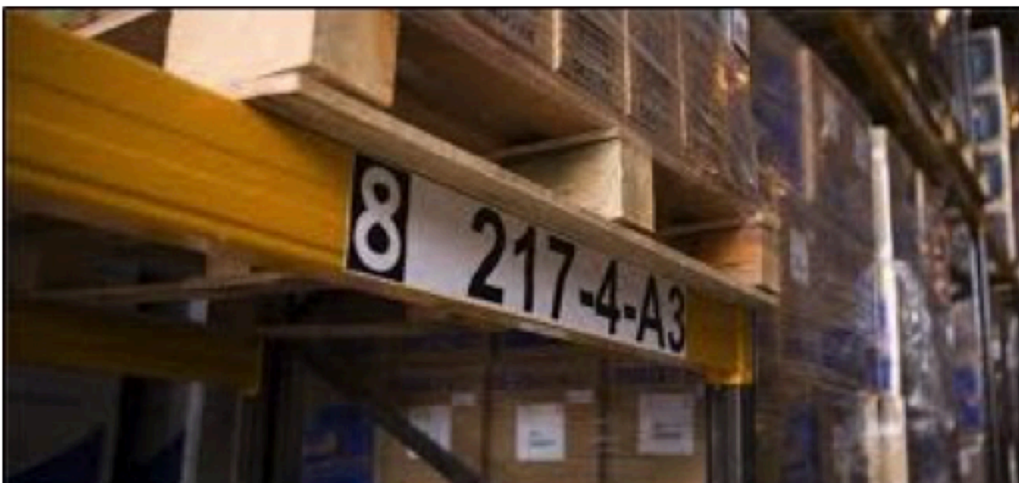
Figura 1: Identificação das prateleiras.

O sistema de gestão possui opções para emissão de relatórios de movimentação de materiais como, curva ABC, rotatividade de materiais, valor agregado entre outros, possibilitando efetuar contagens com a utilização destes. A figura 2 mostra a forma como as prateleiras são identificadas.